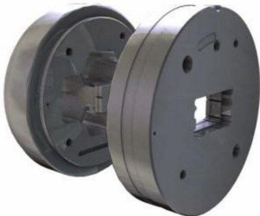
Werkzeuge für Hohlprofile