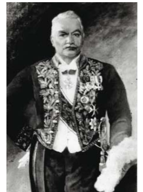
Sam Eyde mottok gjennom livet en lang rekke utmerkelser. Årene i Polen skulle gi enda flere.