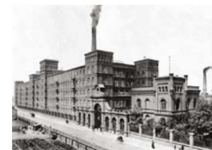
En stor tekstilindustri i Łódź, beregnet på 150 millioner mennesker, vekket norsk interesse for dette området.