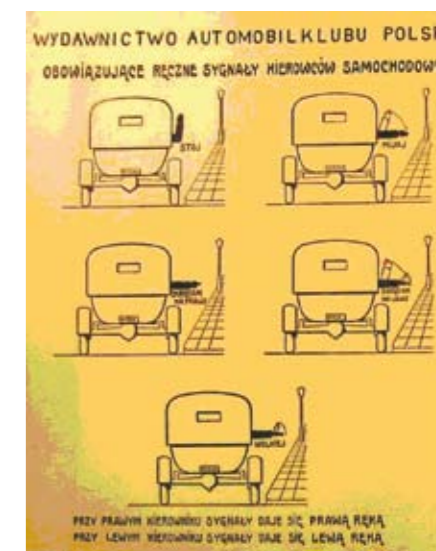
Som den bil-entusiast Sam Eyde var, var det naturlig at han kjøpte bil da han kom til Polen. Han ble også medlem av Polsk Automobilklubb fra 22. september 1921, en klubb som var blitt opprettet 12. januar samme år. Denne illustrasjonen, som er tatt vare på blant Eydes etterlatte papirer, viser signaler som sjåføren måtte bruke for å angi retningen.